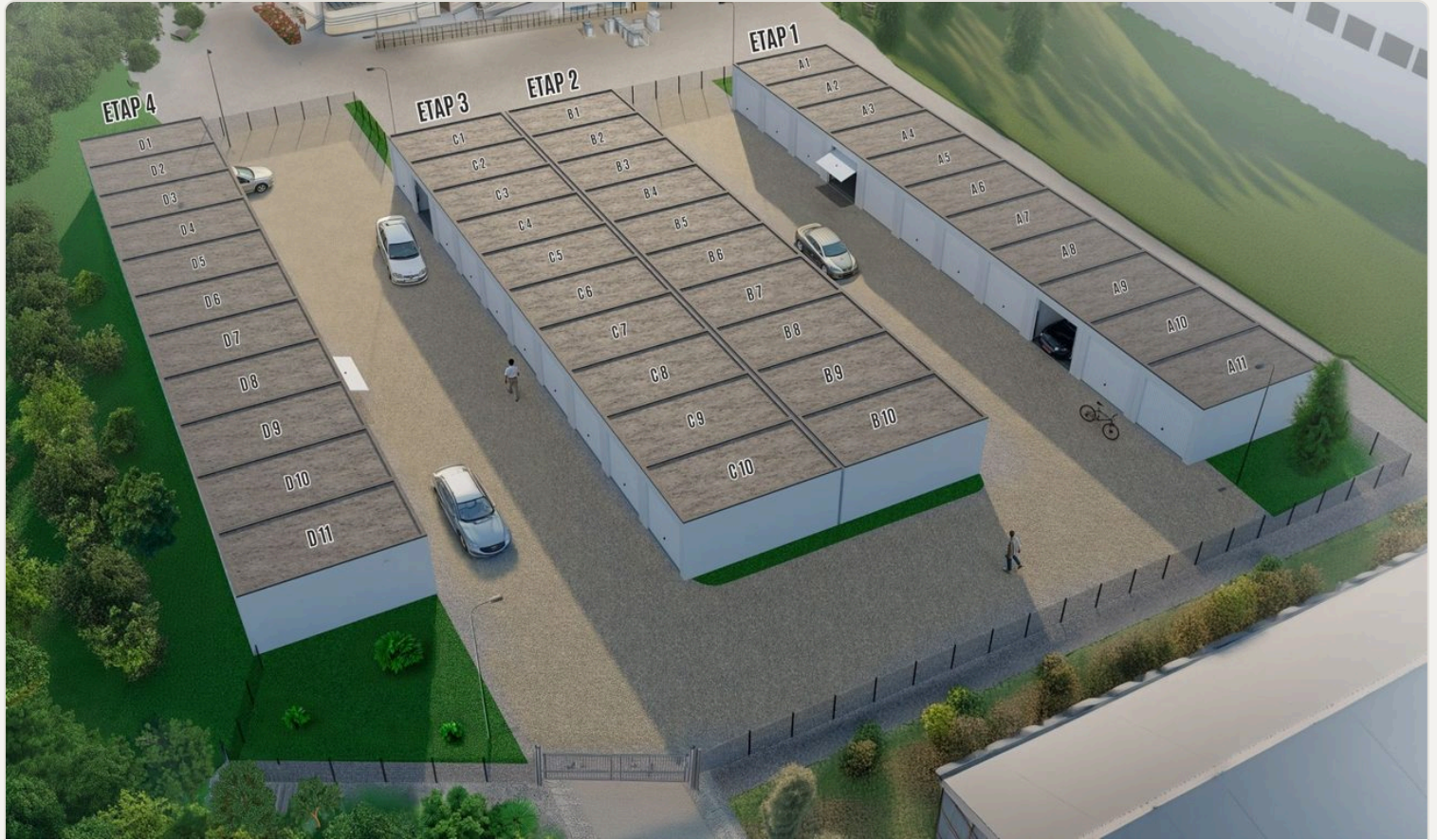
Wizualizacja całości inwestycji – podział na etapy I-IV (ul. Kolejowa 2a).